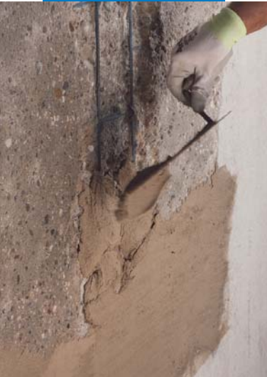
Applicazione a cazzuola di Planitop Rasa & Ripara