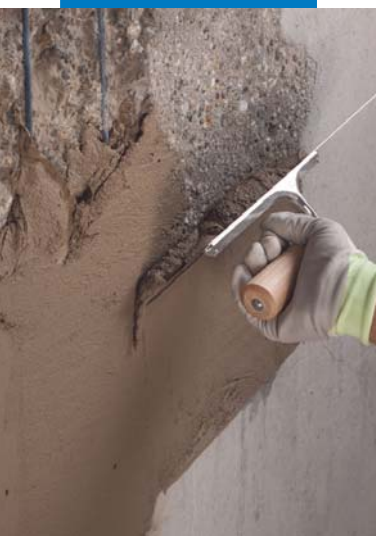
Applicazione a spatola di Planitop Rasa & Ripara

Planitop Rasa & Ripara: malta cementizia tissotropica fibrorinforzata a presa rapida, a ritiro compensato, per il ripristino e la rasatura del calcestruzzo, marcata CE secondo CPD 89/106 in conformità ai requisiti della norma EN 1504-3 classe R2 e della norma EN 1504-2 rivestimento (C) principi MC e IR.