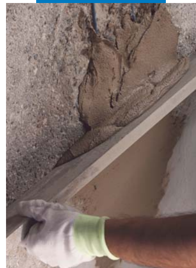
Staggiatura di Planitop Rasa & Ripara