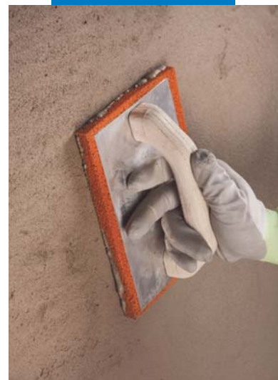
Frattazzatura di Planitop Rasa & Ripara