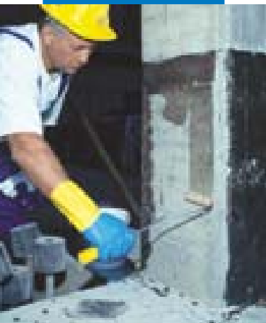
Applicazione della 1ª mano di MapeWrap Primer 1