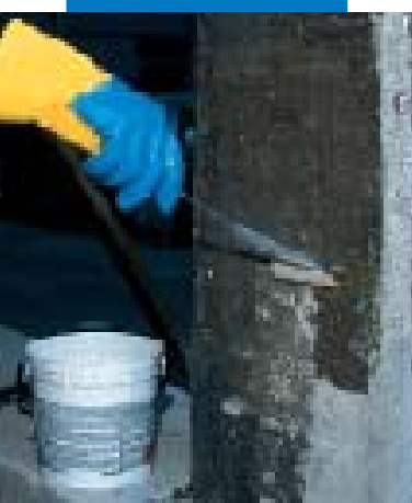
Applicazione della 2ª mano di MapeWrap Primer 1

Mapewrap , prima di applicare Mapewrap Primer 1 , devono essere smussati mediante l'impiego di un martelletto demolitore oppure attraverso l'ausilio di altra idonea attrezzatura. È consigliabile che il raggio di curvatura non sia inferiore a 2 cm.