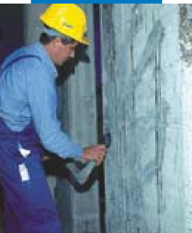
Preparazione del supporto