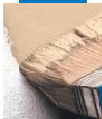
Rivestimento con Elastocolor