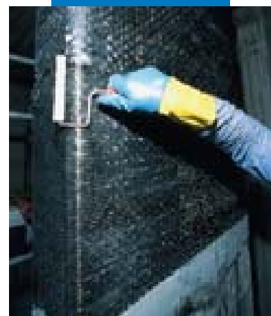
Applicazione della 2ª mano di Mapewrap 31