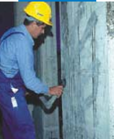
Preparazione del supporto

Versare il Componente B nel Componente A e mescolare, a basso numero di giri, con trapano dotato di agitatore, fino ad ottenere la completa omogeneizzazione della resina fluida. Rapporto di miscelazione: 4 parti in peso di Componente A e 1 parte in peso di