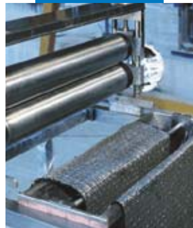
Impregnazione a macchina di Mapewrap C