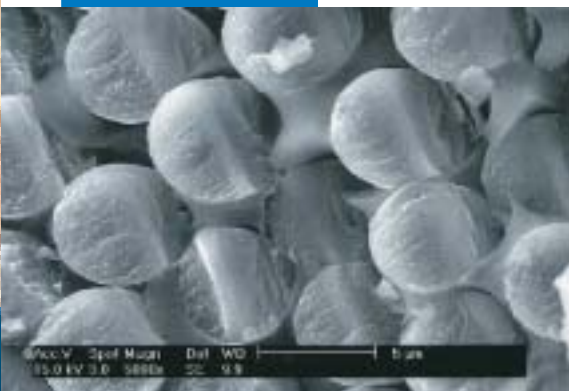
Microfotografia di un composto strutturale a matrice polimerica dal Laboratorio di Ricerca e Sviluppo Mapei

Le referenze relative a questo prodotto sono disponibili su richiesta