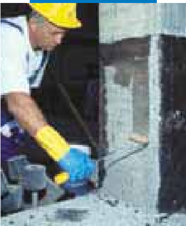
Applicazione di MapeWrap Primer 1