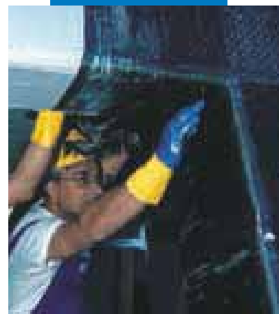
Fasciatura di un nodo