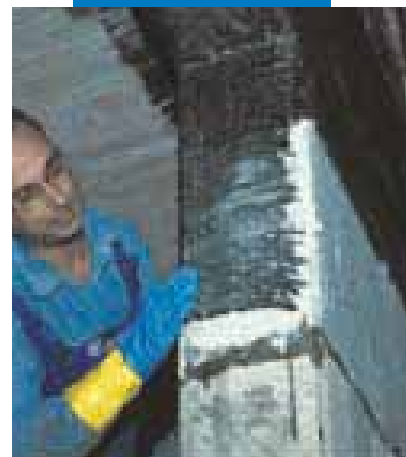
Fasciatura di pilastri e travi