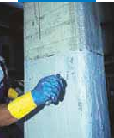
Rasatura con MapeWrap 11 o MapeWrap 12