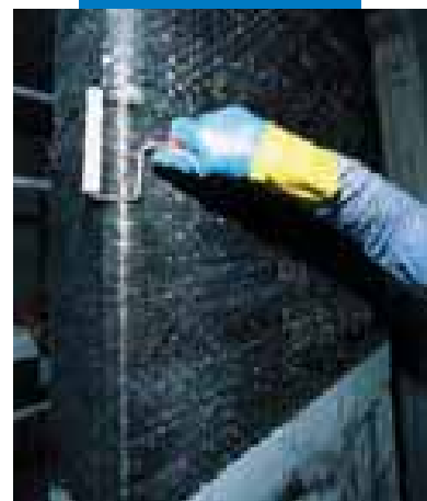
Applicazione della seconda mano di MapeWrap 31

Le referenze relative a questo prodotto sono disponibili su richiesta