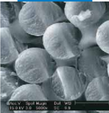
Microfotografia di un composto strutturale a matrice polimerica dal Laboratorio di Ricerca e Sviluppo Mapei