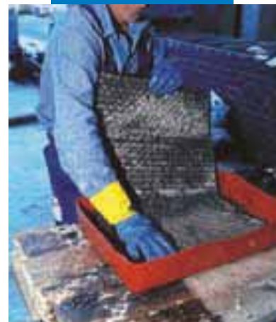
Impregnazione manuale di Mapewrap C