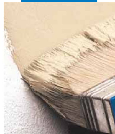
Rivestimento con Elastocolor Pittura