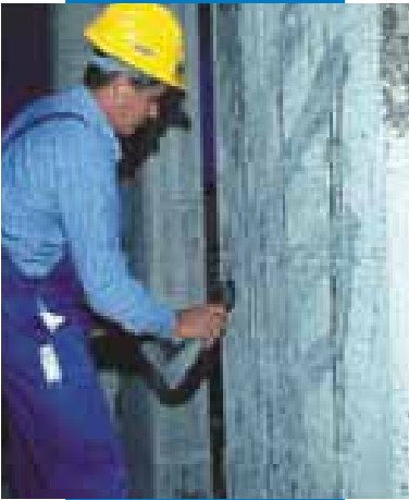
Preparazione del supporto