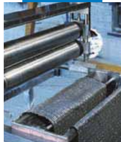
Impregnazione a macchina di Mapewrap C