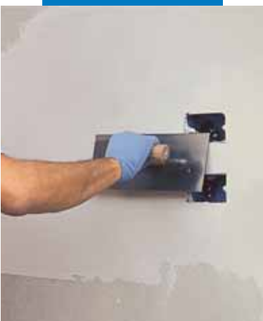
Applicazione di Planitop 520 con spatola metallica