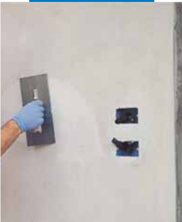
Applicazione di Planitop 520 con spatola metallica