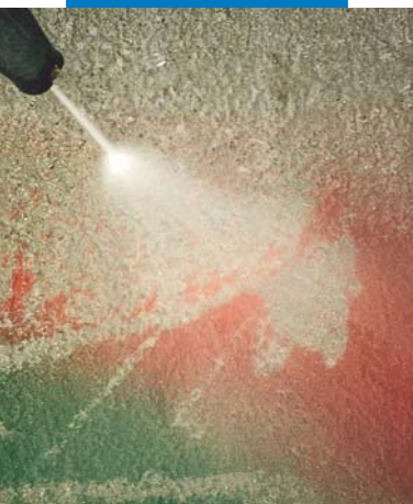
Lavaggio con acqua in pressione di calcestruzzo trattato con WallGard Graffiti Barrier

N.B. La rimozione dei graffiti dalle superfici trattate con WallGard Graffiti Barrier viene effettuata con acqua in pressione alla temperatura di +80°C; si raccomanda di verificare che il supporto sia in grado di resistere a queste sollecitazioni fisiche-meccaniche.