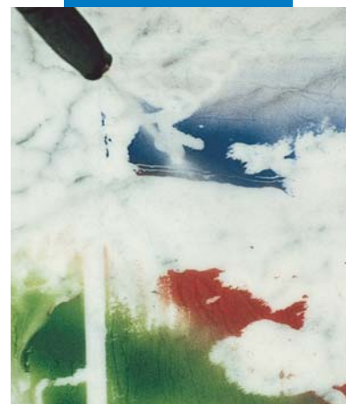
Lavaggio con acqua in pressione di marmo di Carrara trattato con WallGard Graffiti Barrier

migliore esperienza, sono da ritenersi, in ogni caso, puramente indicative e dovranno essere confermate da esaurienti applicazioni pratiche; pertanto, prima di adoperare il prodotto, chi intenda farne uso è tenuto a stabilire se esso sia o meno adatto all'impiego previsto e, comunque, si assume ogni responsabilità che possa derivare dal suo uso.