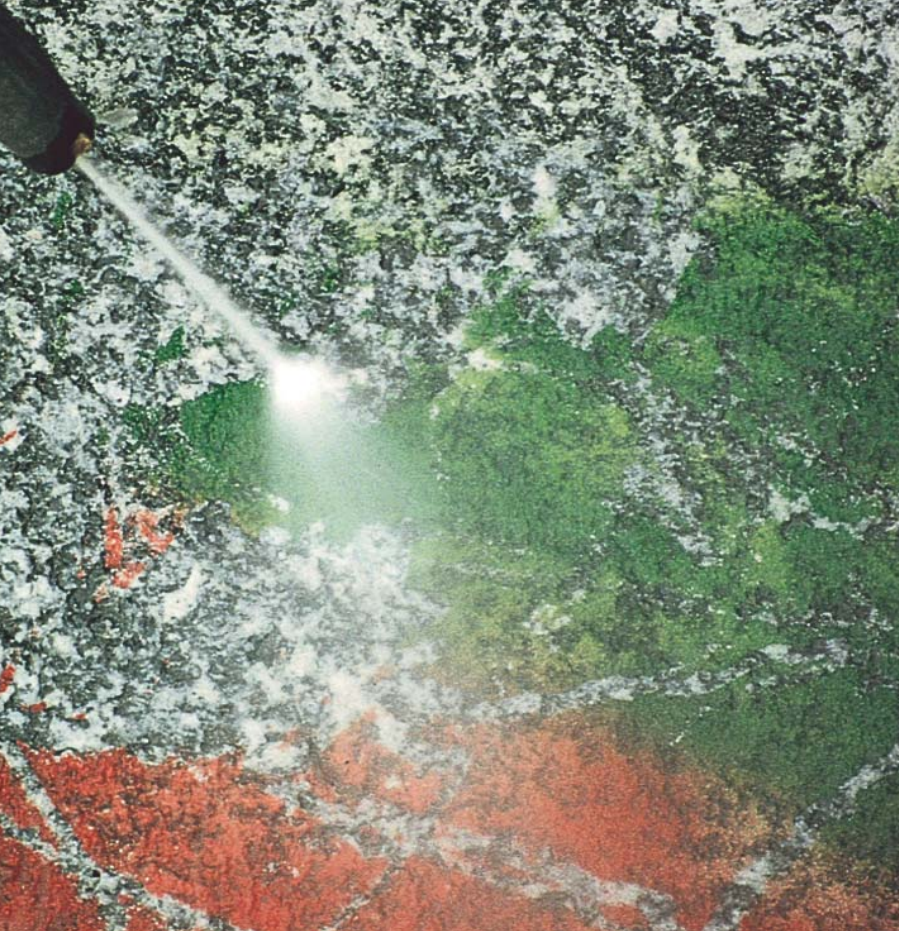
Lavaggio con acqua in pressione di serizzo trattato con WallGard Graffiti Barrier