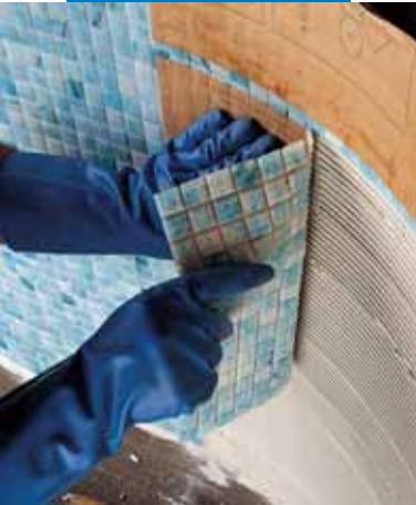
Posa di mosaico vetroso 2x2 in piscina con Adesilex P10 più Isolastic diluito 1:1 con acqua