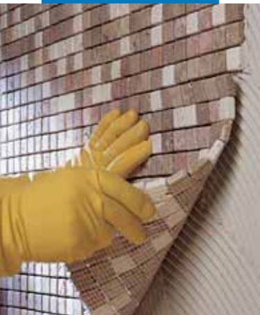
Posa di mosaico di marmo 2x2 a parete