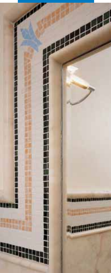
Esempio di decorazione eseguita con mosaico di materiali vari

Le referenze relative a questo prodotto sono disponibili su richiesta e sul sito Mapei www.mapei.it e www.mapei.com