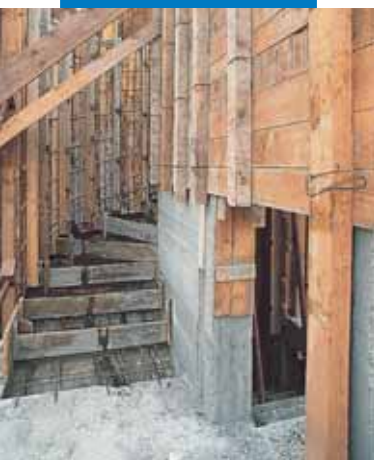
Esempi di casseforme trattate con Disarmante DMA 1000