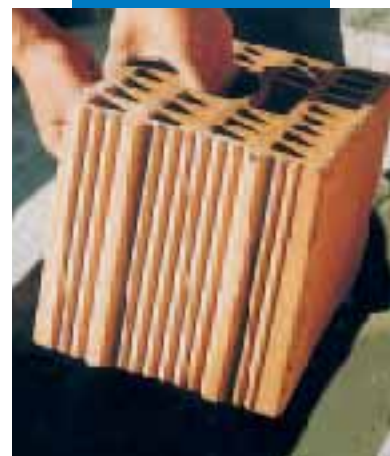
Immersione del blocco in laterizio nell'Adesilex P4