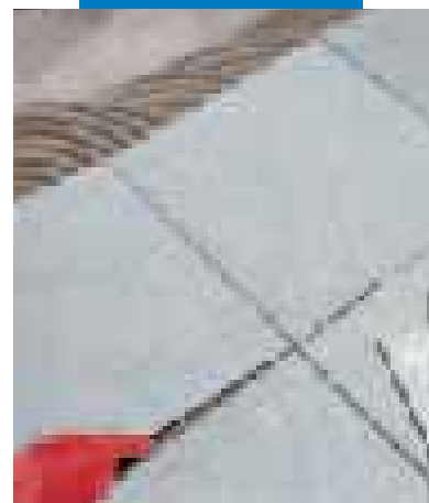
Posa di gres porcellanato