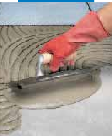
Stesura con spatola a dente semicircolare