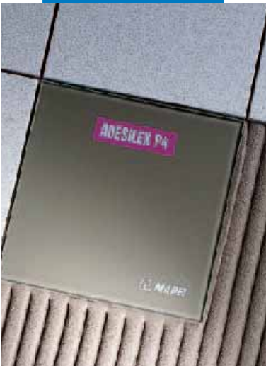
Confronto di bagnatura tra adesivo normale e Adesilex P4