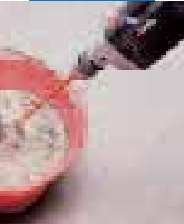
Impasto di Adesilex P4