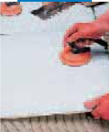
Posa di grande formato