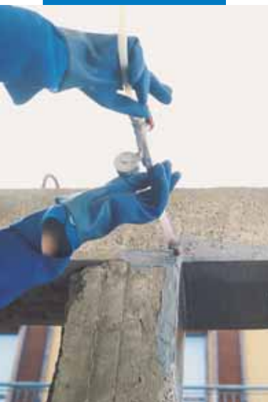
Trave placcata con Adesilex PG1