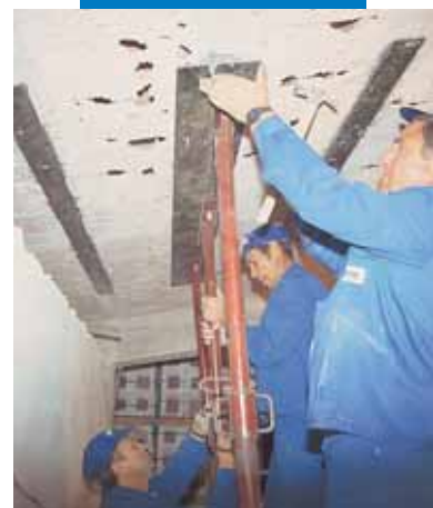
Messa in opera di placca metallica per rinforzo strutturale