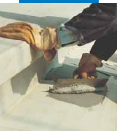
Stesura a spatola dentata di Adesilex PG1 per incollaggio strutturale di gradini prefabbricati