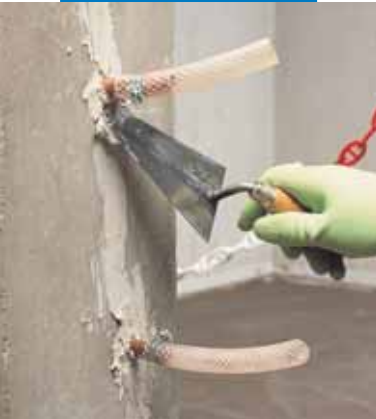
Fissaggio di tubi di iniezione e stuccatura delle fessure nel consolidamento strutturale