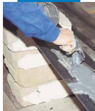
Stesura di Adesilex PG1 su placca metallica