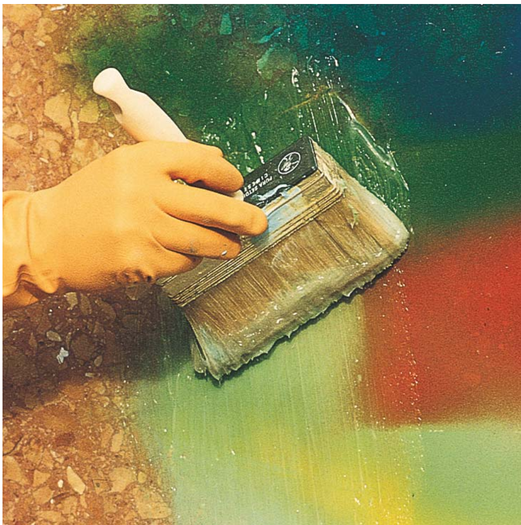
Applicazione di WallGard Graffiti Remover Gel su pietra naturale