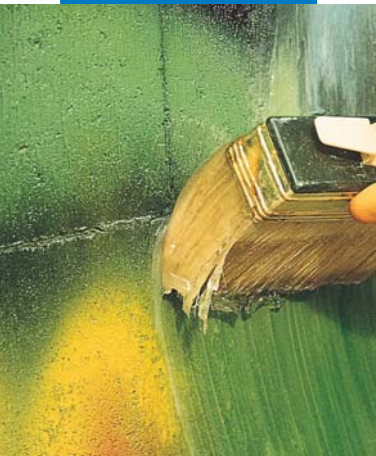
Applicazione di WallGard Graffiti Remover Gel a pennello