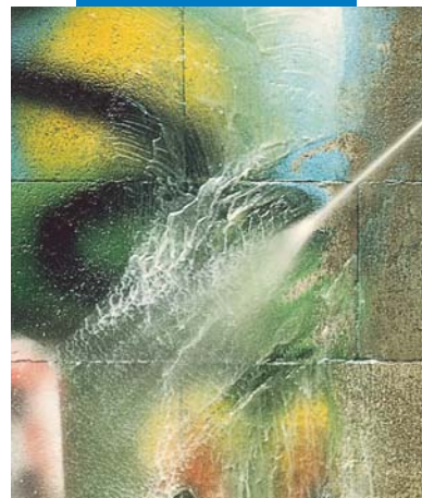
Lavaggio con acqua in pressione

Le referenze relative a questo prodotto sono disponibili su richiesta e sul sito www.mapei.it e www.mapei.com