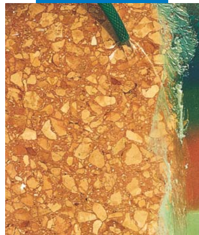
Rimozione del graffito mediante spazzolatura e lavaggio