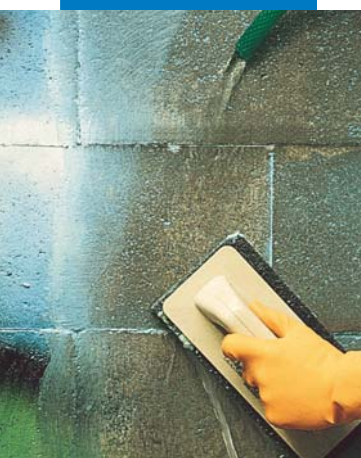
Pulizia con feltro abrasivo