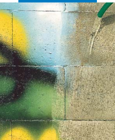
Lavaggio con acqua corrente