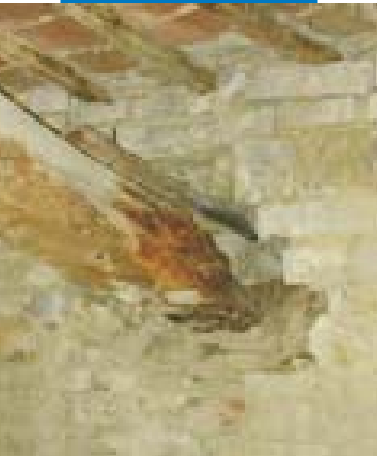
Trave degradata sull'appoggio