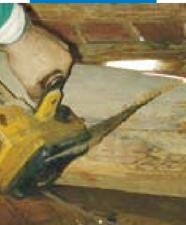
Taglio della trave