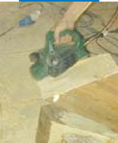
Preparazione della protesi