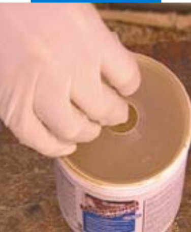
Posizionamento del disco estrusore