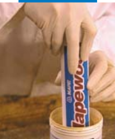
Riempimento della cartuccia