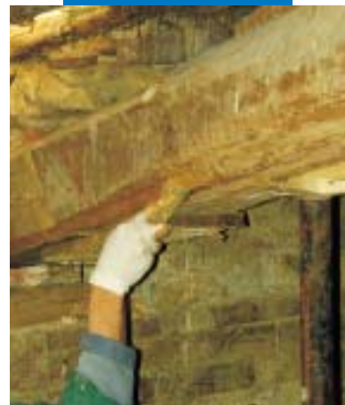
Applicazione di Mapewood Paste 140